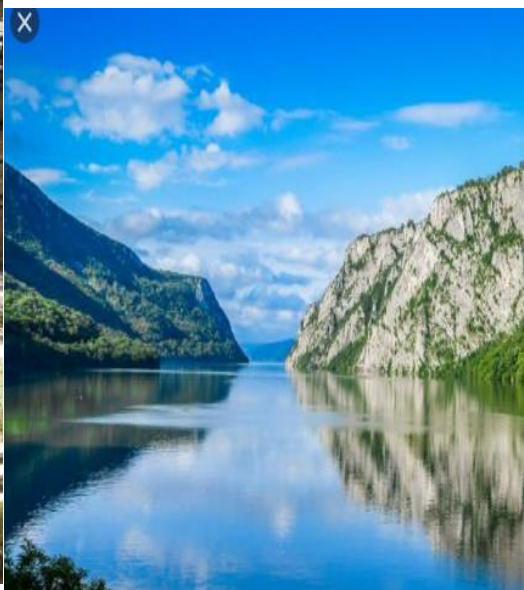
Ђердапска клина 29. Јун дан Дунава